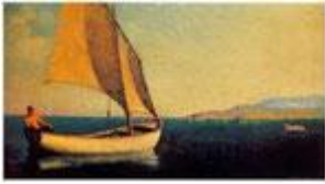
El bote de vela

Los pueblos Babilónicos se interesaron desde mucho tiempo en el estudio de las estrellas y el cielo y la mayoría ya podía predecir eclipses y solsticios. Este interés se fue desarrollando con el pasar de los años y pudieron elaborar un calendario de 12 meses sobre la base de los ciclos lunares. Dividieron el año en dos estaciones: invierno y verano y es, desde ese entonces, que se origina la astronomía y la astrología.